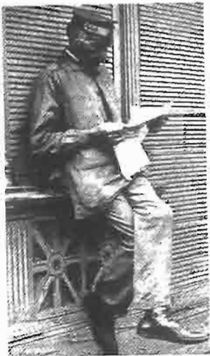
Jak se před sto lety četly noviny: ve chvíli oddechu