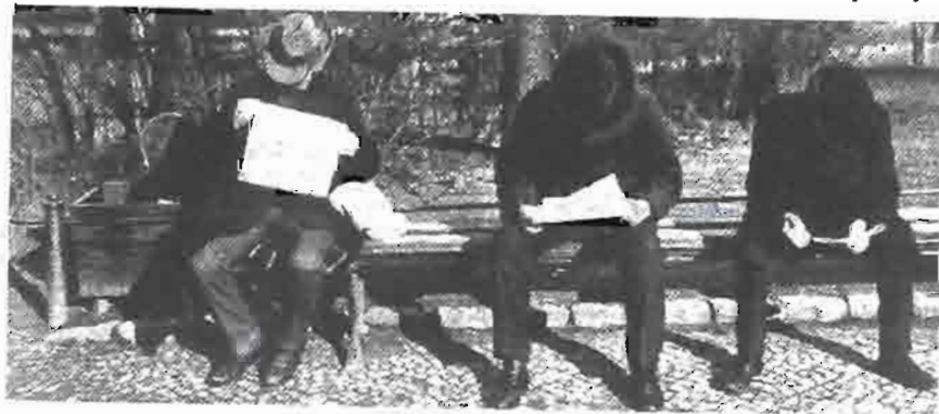
Jak se před sto lety četly noviny: na lavičce v parku; Časopis Český svět , září 1910

Tou dobou, pravda, mělo už žurnalistické vzdělání v Evropě i ve Spojených státech své první zkušenosti dávno za sebou, na různých místech vznikaly samostatné žurnalistické vzdělávací instituce a současně se žurnalistika etablovala na univerzitní půdě.